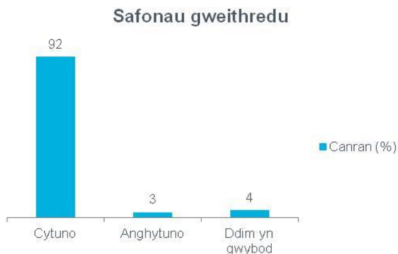
Ffigur 4 Ymateb i gwestiwn 4 yr holiadur - Safonau gweithredu 8

Dengys y ffigur isod sut yr ymatebodd aelodau'r cyhoedd i'r cwestiwn hwn: