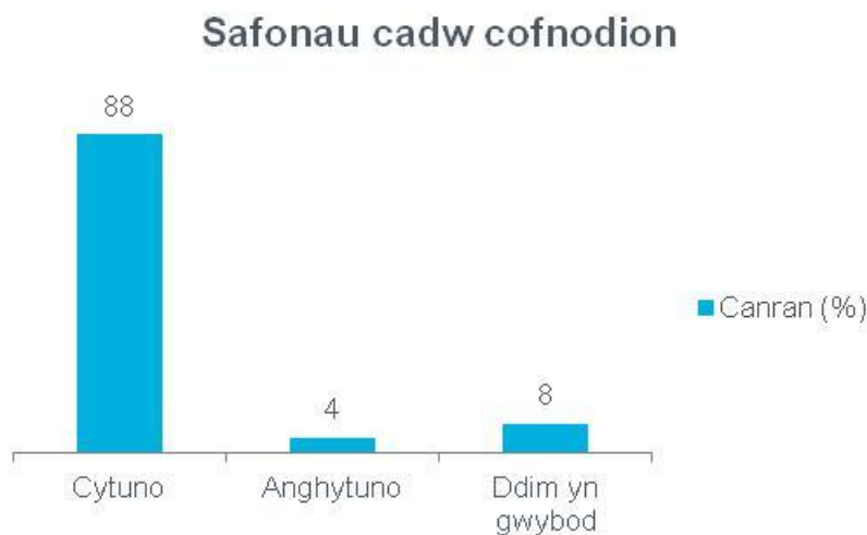
Ffigur 5 Ymateb i gwestiwn 5 yr holiadur - Safonau cadw cofnodion 9

Dengys y ffigur isod sut yr ymatebodd aelodau'r cyhoedd i'r cwestiwn hwn: