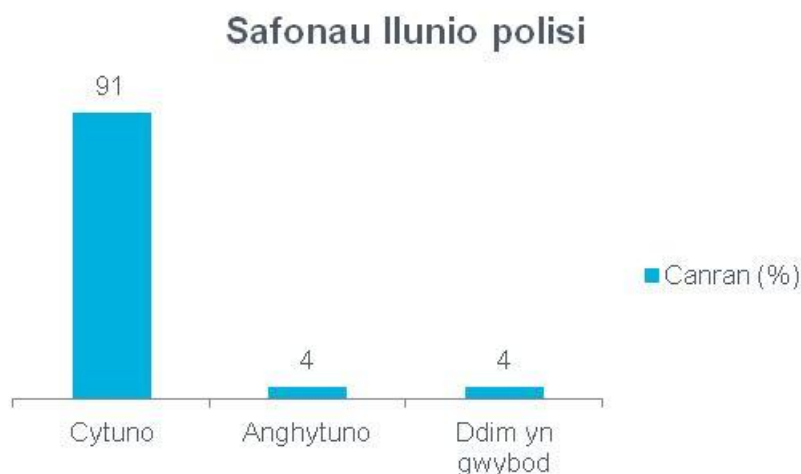
Ffigur 3 Ymateb i gwestiwn 3 yr holiadur - Safonau llunio polisi 7